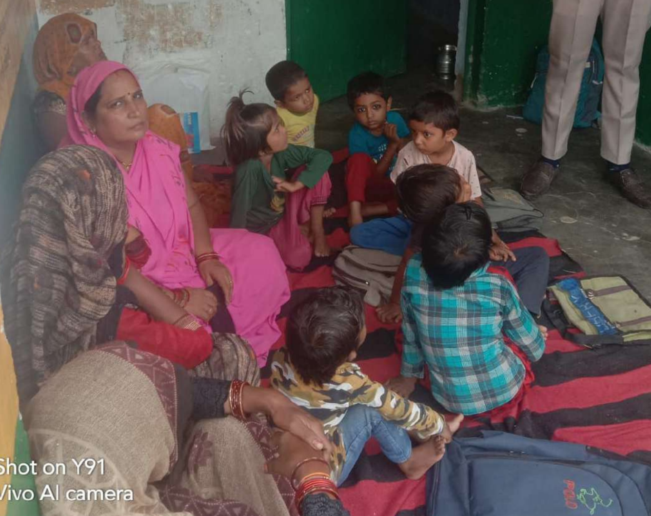
Shot on Y91 Vivo AI camera