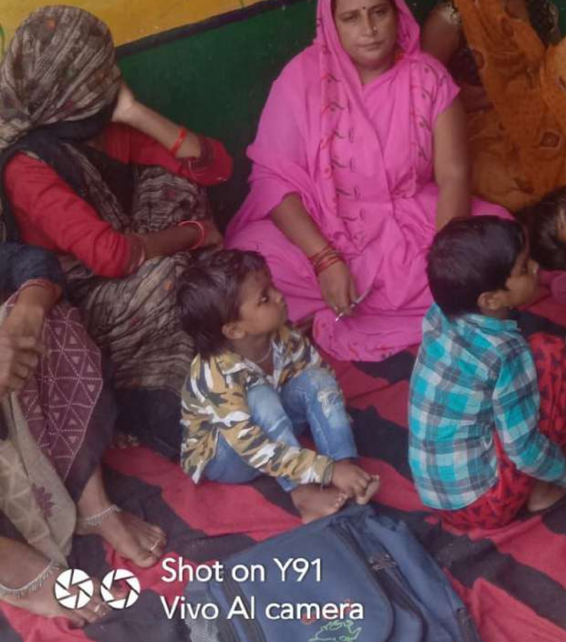
Shot on Y91 Vivo AI camera